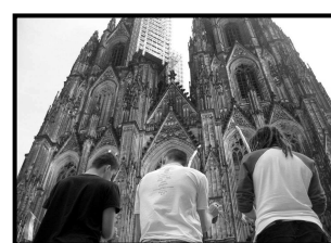
Uczniowie CPPA Niemcy

* Ciekawostka: Capoeira jest obecna w ponad 150 krajach i jest największym środkiem rozpowszechniającym język portugalski w świecie. Companhia Perna Pro Ar, dla przykładu, realizuje swą pracę w pięciu zagranicznych krajach (Niemcy, Polska, Syria, Bułgaria i Grecja), popularyzując nie tylko język, ale również naszą kulturę.