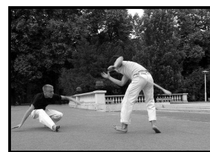
Uczniowie CPPA Polska